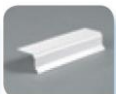
Garniture d'extrémité de plaque