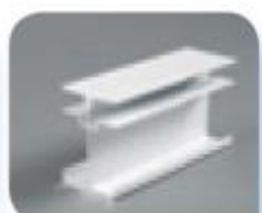
Profil de jonction