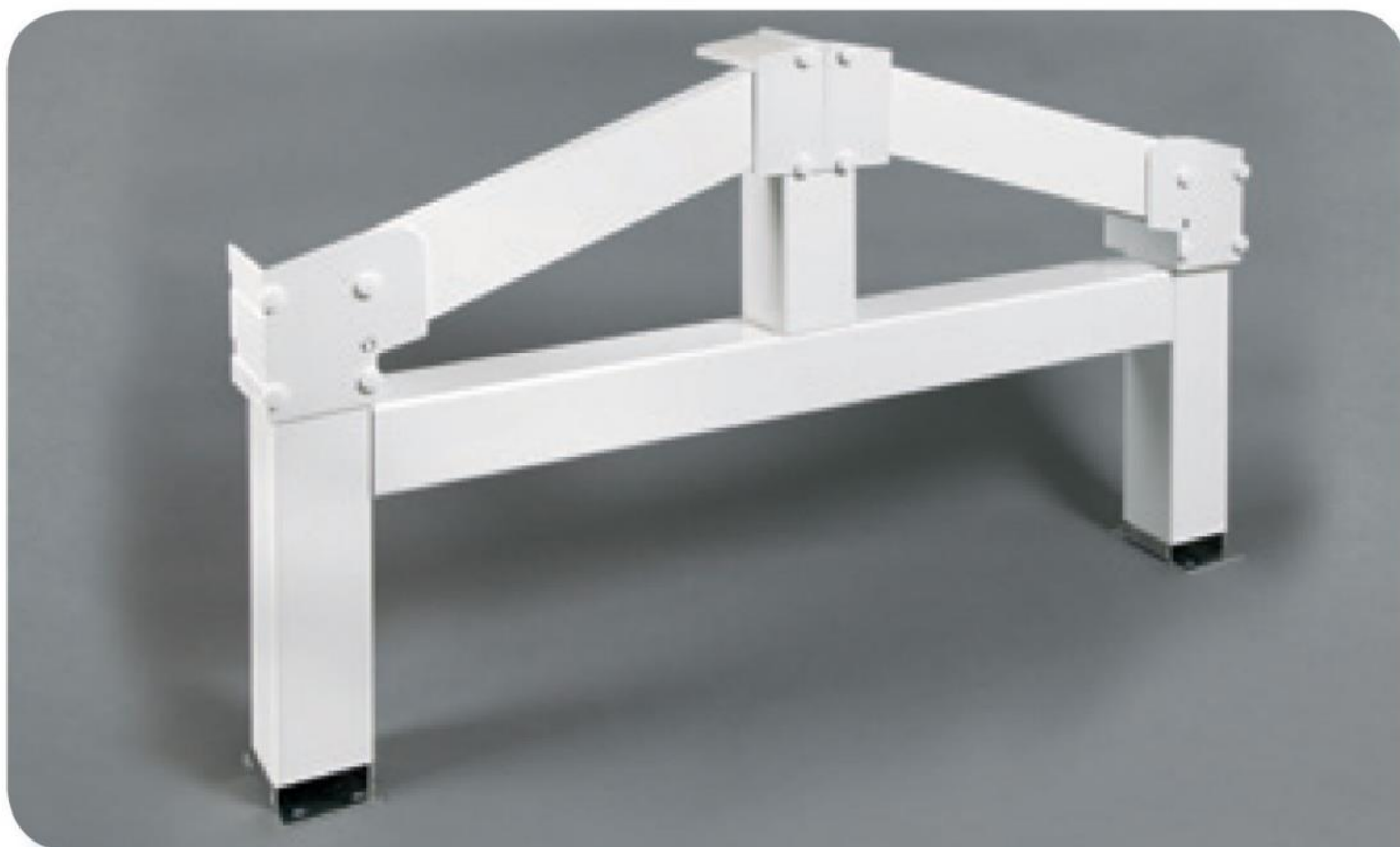
Conception de toit à pignon